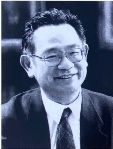
経済団体連合会専務理事 糠沢和夫氏