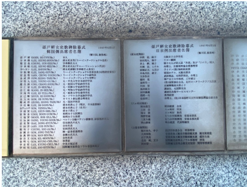
歌碑除幕式参列者名簿。左側が韓国出席者、右側が日本出席者