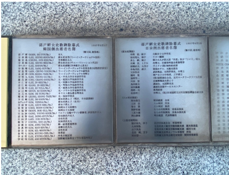
歌碑除幕式参列者名簿。左側が韓国出席者、右側が日本出席者